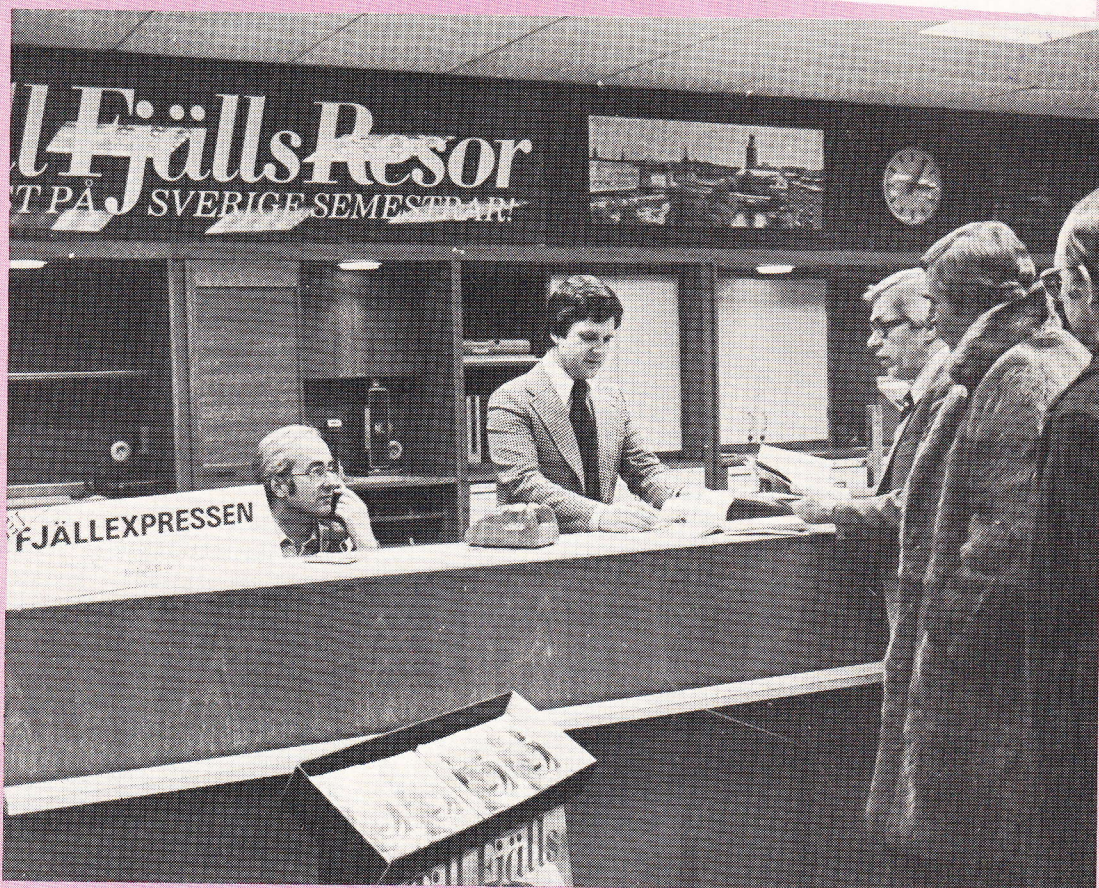
Till Fjälls Resor har öppnat en egen avdelning på SJ Resebyrå i Malmö. Det är här som chartertågen ska säljas.