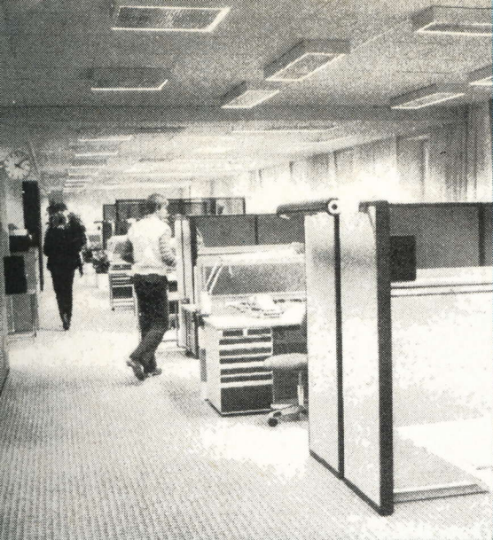
Stora sköna utrymmen i andra våningsplanet. Ovan.